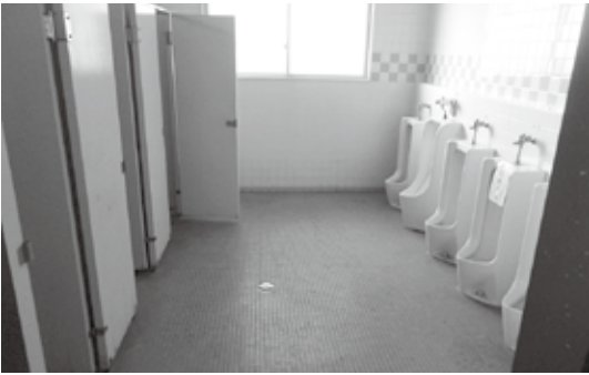
蔵波中トイレ（工事前）