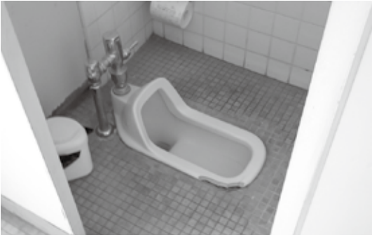
根形中トイレ（工事前）