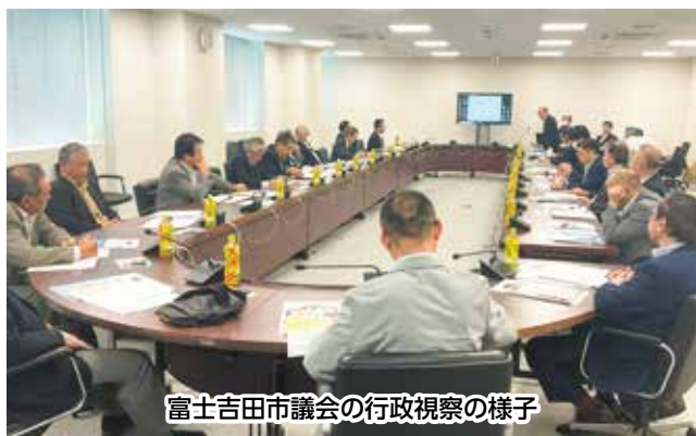
富士吉田市議会の行政視察の様子