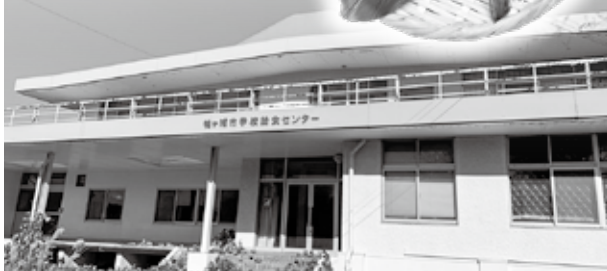
旧学校給食センター