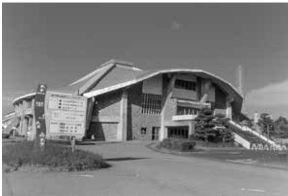
臨海スポーツセンターの今後のあり方を検討中

A R5年度に臨海スポーツセンターの今後の活用に関するサウンディング調査を行い、民間事業者5社から意見を伺いました。4月下旬以降に内容を公表し、今後のあり方について引き続き検討をしていく予定です。