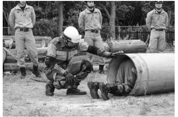
震災対応訓練を行う消防団員