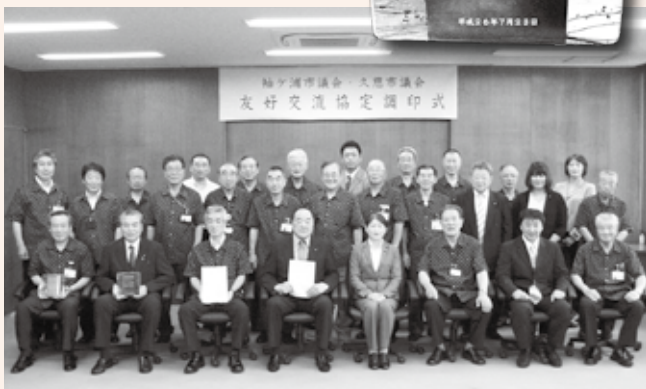
平成26年7月 友好交流協定