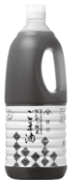
袖ヶ浦の返礼品として人気のごま油

A R4年度の本市への寄付金額約8,707万円に対し、市税控除額は約1億6,374万円です。その他、事業費が約3,870万円かかっているため、差し引きは約マイナス1億1,540万円という状況です。