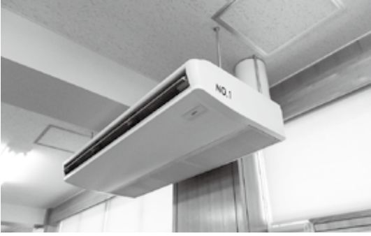
蔵波小 図書室エアコン（工事前）